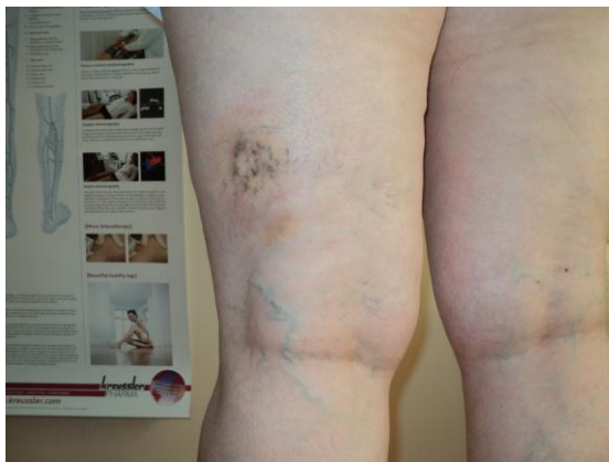
1 nedēļa pēc 1.skleroterapijas seansa. Neliels lokāls iekaisums, pigmentācija.