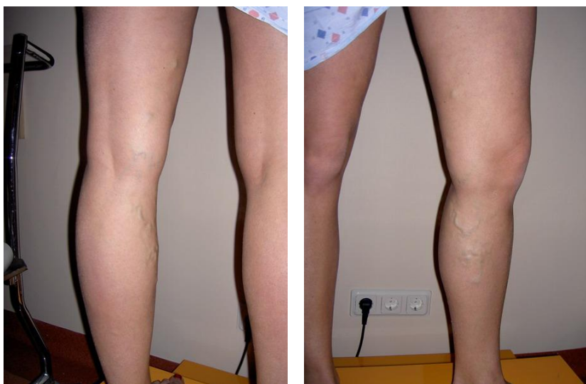
Pacientei lielās zemādas vēnas stumbra un zaru varikoze (iezīmēts)