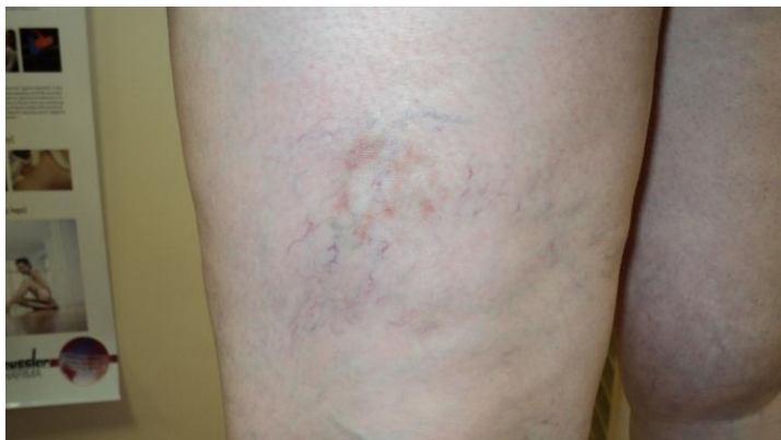
1 mēnesis pēc skleroterapijas. Iekaisums, pigmentācija izzūd. Venoza pinums gandrīz izzudis. Paciente plāno nākamo skleroterapijas seansu zemāk lokalizētai vēnai