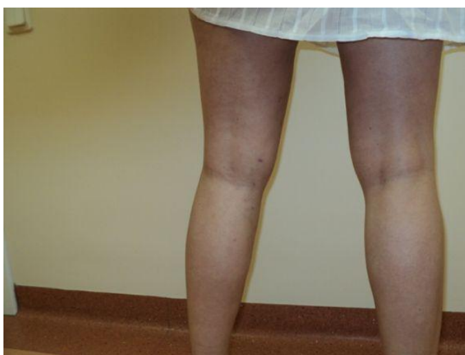
1,5 mēnesis pēc operācijas Sīkās rētiņas pakāpeniski izbalēs un kļūs neredzamas!