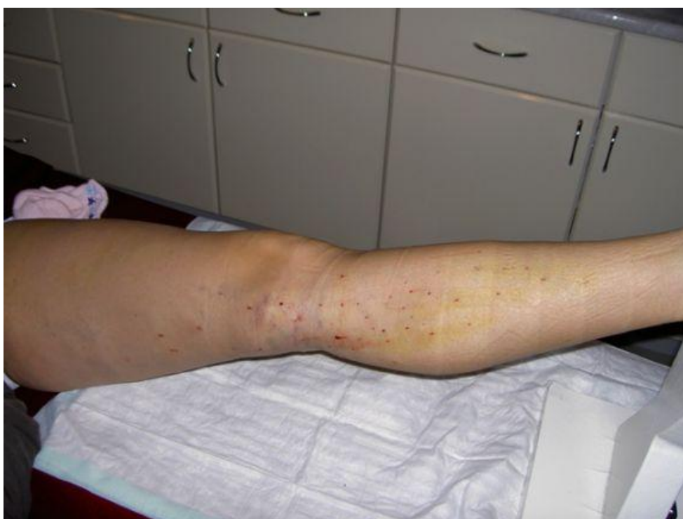
1. pēcoperācijas diena: veikta lielās zemādas vēnas un varikozo zaru mikroķirurģiska operācija pēc Varady tuminiscentā anestēzijā