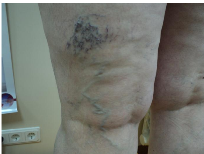
Pirms skleroterapijas. Pacientei konstatēts varikozo vēnu samezģlojums.