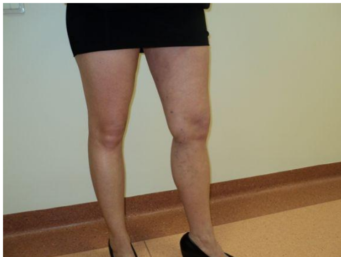
3 nedēļas pēc operācijas